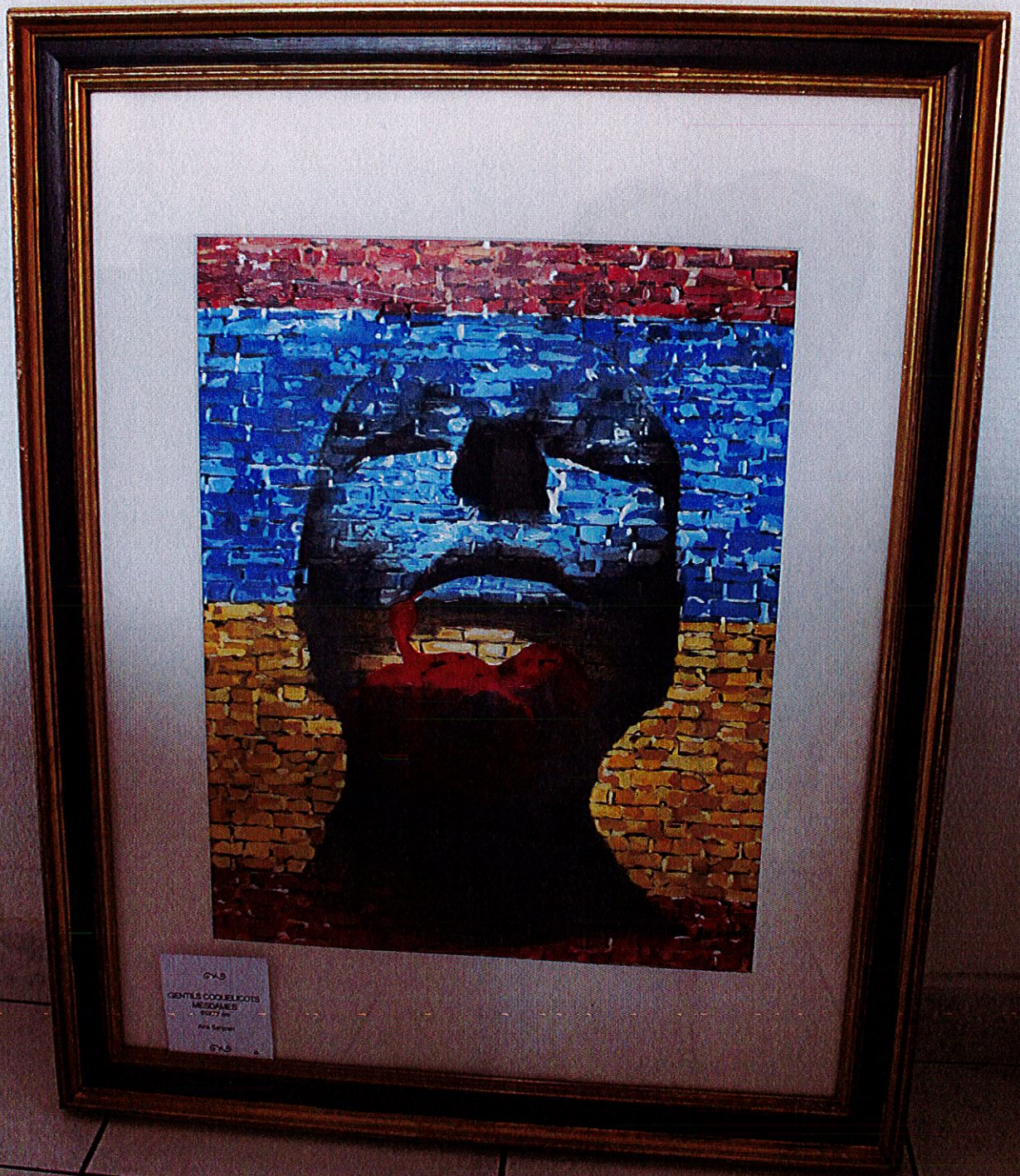
043 GENTILS COQUELIGOTS MISDAMES 1977 cm Aria Sapiro 043

Accusé de réception en préfecture 066-216600114-20230206-DEL2023-004-DE Date de télétransmission : 08/02/2023 Date de réception préfecture : 08/02/2023